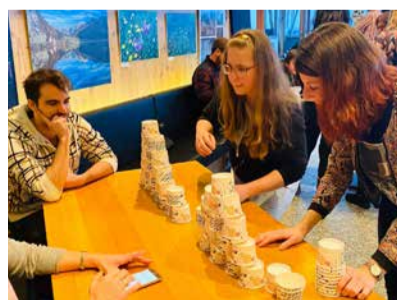
Voller Einsatz an der «Lihnpiade».

Restaurant serviert wurde. An verschiedenen Posten wie Lihn-Pong, Black Jack, Darts, Türmli bauen und Pantomime waren Geschicklichkeit, Mut und Geduld gefragt. Alle waren voller Tatendrang und Freude, und so wurde gezielt, gebaut, gespielt und «pantomiert».