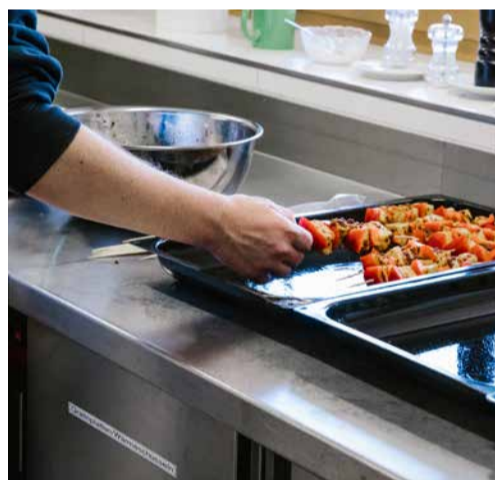
Aufbautraining in den Werkstätten des Menzihuus und im Hotel Lihn.