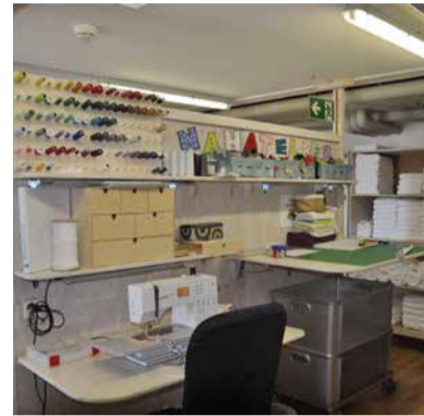
In der heutigen Wäscherei herrschen enge Platzverhältnisse.

Mit dem Neubau schaffen wir eine nachhaltige Zukunft für das Menzihuus. Dort finden mehr Menschen eine Arbeit und sinnstiftende Tagesstruktur, und wir können der hohen Nachfrage nach unseren Arbeits-